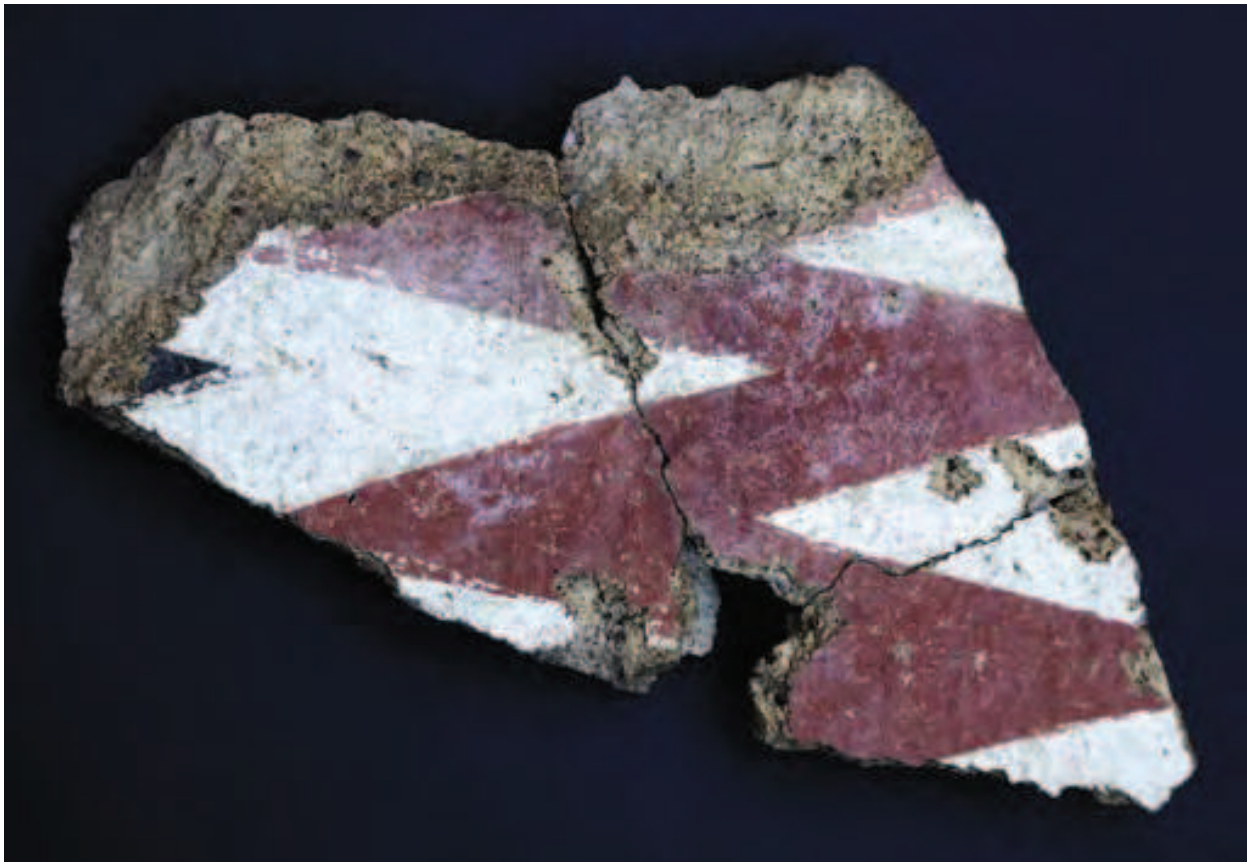
FIGUR 5. Tagtegl. Stykket er sammensat af tre fragmenter og måler 22,5 x 19,5 cm. I forbindelse med templer var det almindeligt at udsmykke undersiden af det nederste tagtegl, som hang ud over tagkonstruktionen og derfor var synligt for de forbigående. Dekorationen bestod af bemaling i farverne rød, hvid og sort. Motivet kunne være en zigzag, som det ses her, men også en mæander eller et kryds. Udgravningsfoto.

først planere området. Dette gjorde de med en blanding af jord og byggematerialer fra de bygninger, der i forvejen stod på stedet, og som blev ødelagt ved anlægsarbejdet. I det vigtigste af fyldlagene fandt vi blandt andet resterne af et tegl dekoreret med et zigzag-mønster i farverne sort, hvid og rød (FIGUR 5). Lignende tegl er fundet i forbindelse med etruskiske templer i det mellemitaliske område. Laget indeholdt også en stor bronzemønt med en fremstilling af en kammuslingskal på den ene side, og på den anden ses en caduceus, som er den heroldstav gudernes sendebud Mercur afbildes med. Mønten kan dateres til perioden ca. 300-250 f.Kr. og er sammen med det øvrige materiale med til datere anlæggelsen af forum til den mellemrepublikanske periode, dvs. tidligst i løbet af 200-tallet f.Kr. (FIGUR 6). Efter planeringen blev pladsen belagt med et 0,30 m tykt lag af kalk og flodsten, som dannede underlag for de store rektangulære travertinplader, der udgjorde belægningen på forum. Til vor store glæde fandt vi to intakte plader