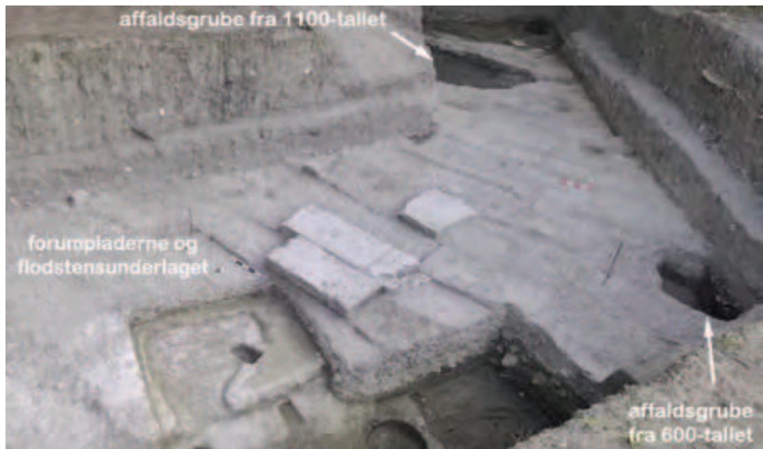
FIGUR 7. Forum. Pladsen var fundamenteret med flodsten og belagt med store travertinplader, hvoraf to intakte er tilbage. Man ser tydeligt sporene efter de plader, som er blevet fjernet for at blive genanvendt i senere tiders bygninger. Udgravningsfoto.

I de efterfølgende århundreder blev det antikke forum gradvist plyndret for sine travertinplader, og beboelser af mindre permanent karakter blev opført. Den tidligst dokumenterede ødelæggelse er en stor og dyb nedgravning i det sydøstlige hjørne, dateret til mellem 400 og 700 e.Kr. (FIGUR 7). Ifølge overleveringen blev Nomentum ødelagt af longobarderne i 700-tallet e.Kr., men om denne ødelæggelse var total, eller om der var tale om en gradvis affolkning, er uvist. Nomentums forum, eller resterne heraf, var i hvert fald forsat synligt og i brug helt frem til middelalderen i 900- og 1000-tallet e.Kr. Herefter lå pladsen tilsyneladende ubenyttet hen og blev langsomt dækket af jord, som blev vasket ned fra det nærliggende højdedrag Montedoro. Fra og med det tidlige 1100-tal e.Kr. blev området atter frekventeret. I den nordlige del af trenchen var der en stor nedgravet affaldsgrube med en diameter på knap 3 m, som var fyldt med keramik af enhver slags lige fra det finere bordservice til de grovere kogekar samt forskellige dyrekogler, heriblandt et hestekranium (FIGUR 3 og 7). Den store variation i materialet tyder på, at der lå en beboelse i nærheden.