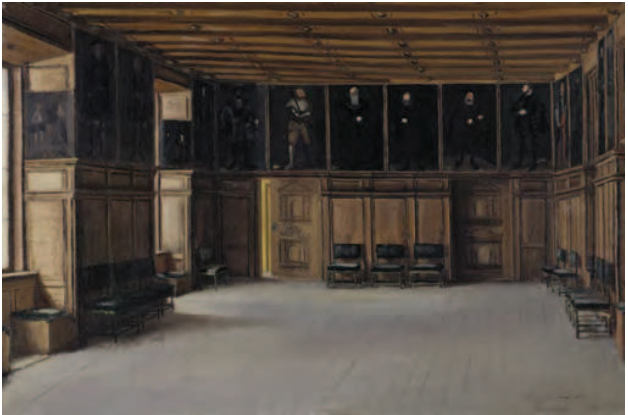
Rigssalen på Gripsholm. Malet af Axel Malmgren i 1879. Olie på lærred. 41 x 64 cm. Nationalmuseum, Stockholm.