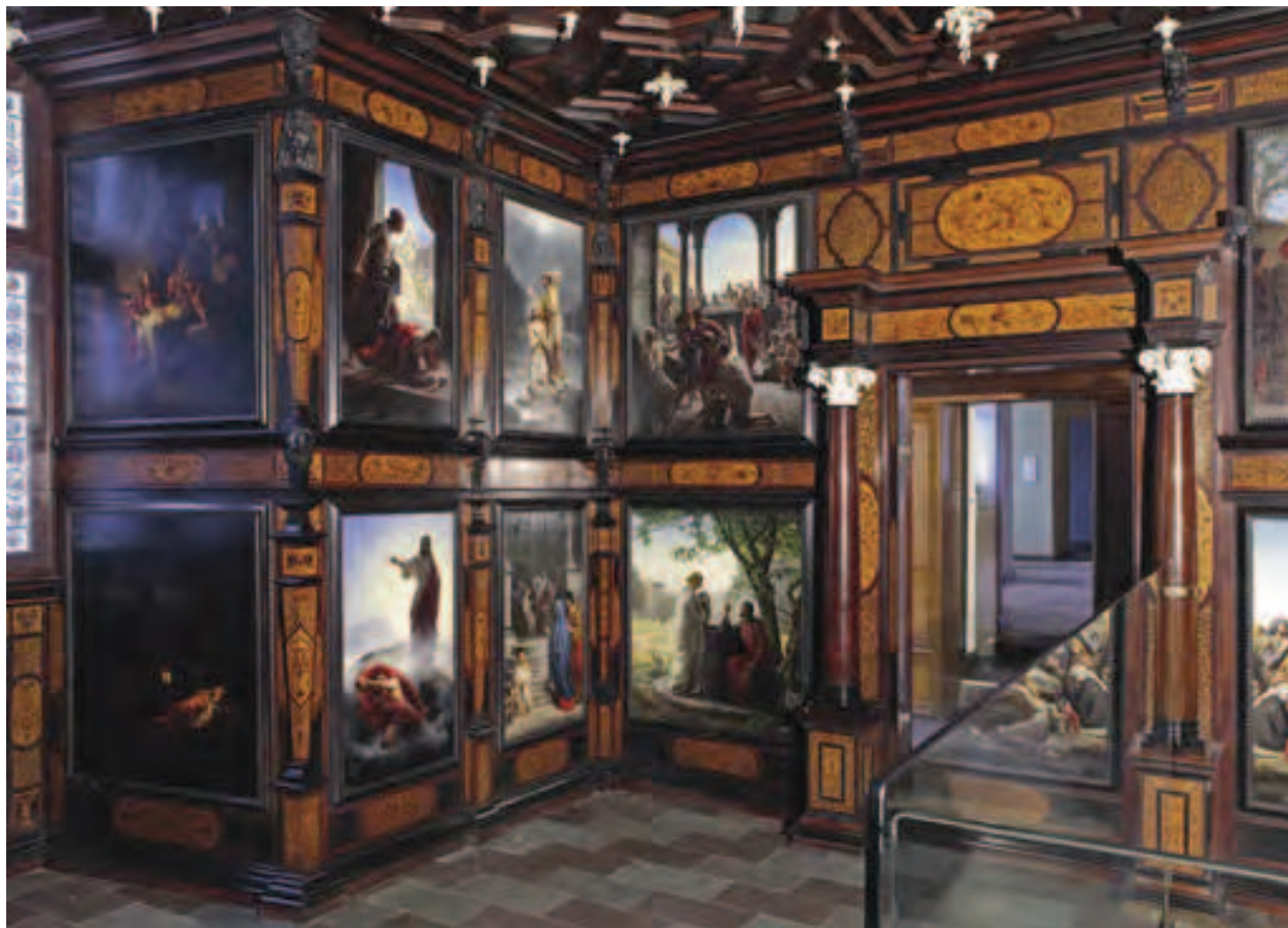
Kongens Bedekammer, set mod vest og nord, og (modstående side) mod nord og øst 2011. Alteret, der blev udført til Christian IV i begyndelsen af 1600-tallet i Augsburg, var ikke på slottet, da branden brød ud.

hvortil jeg svarede, at jeg var belavet på en noget højere pris. Hvis han går ind på foretagendet, er jeg fra min side villig til at modtage og betale omtrent 4 billeder årlig, uden at han dog skal være forpligtet til at udføre dette tal årligt". Bloch havde ikke tabt lysten. Selv om han sideløbende arbejdede med mange andre emner, optog opgaven for bryggeren meget af hans tid, og en løbende indtægt var i sigte! Slutbeløbet blev 600 rdl. pr. stk., i 2011 kroner en meget høj sum.