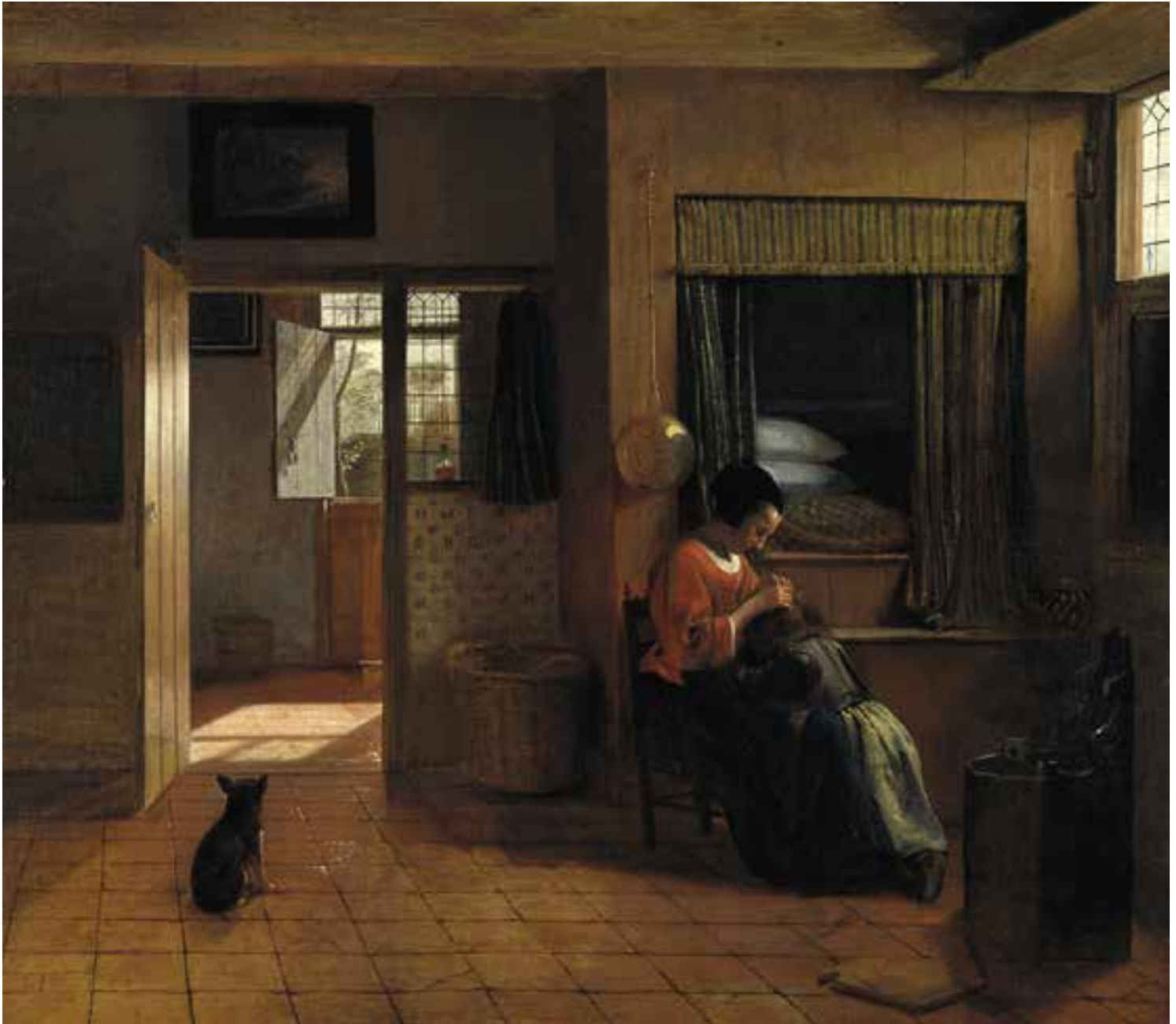
Peter de Hooch: Moedertaak (En moders pligt) (1658-60), Rijksmuseum, Amsterdam.

Det private rum kan være kendetegnet ved for eksempel bestemte aktiviteter, fysiske og arkitektoniske markører så som døre, skærme og forhæng eller en særlig intim atmosfære og reguleret af skrevne og uskrevne regler. De konkrete udformninger af disse faktorer ændrer sig afhængigt af sociale og kulturelle omstændigheder.